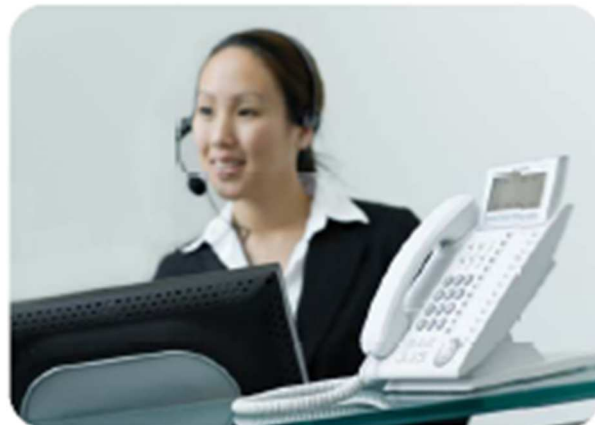
RECEPCIONISTA UTILIZANDO COMMUNICATION ASSISTANT

Operator Console también admite las siguientes funciones adicionales: